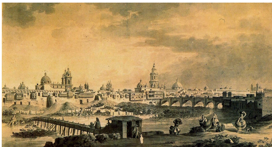
Fig. 3. “Vista de Lima desde las inmediaciones de La Plaza de Toros”, Fernando Brambila, ca. 1793

Estas actividades y desempeños procuraban en buena cuenta aprovechar las bondades del Rímac y sus recursos, entendiéndose el trazado cuadrículado como deleznable y de importancia relativa, en tanto constituía una traba para los vecinos, limitando sus actividades e intereses, que se expresaban mejor a través de formas espontáneas y orgánicas de ocupación del espacio urbano.