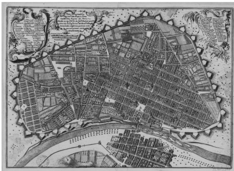
Fig. 1. "Plano Scenographico de la Ciudad de los Reyes o Lima, ...", Antonio de Ulloa y Jorge Juan, 1748.

Respecto a la representación de Lima y su entorno, podemos citar los trabajos de Antonio de Ulloa, insertos en esta mirada racional, matemática e ilustrada del espacio. La carta topográfica del valle de Lima y Callao de 1743, 42 es el primer documento cartográfico que articula el valle y el litoral, incluyendo la topografía marina. Se trata de una mirada de Lima en conjunto, un riguroso levantamiento que incorpora los pueblos, el puerto y la ciudad amurallada. 43 Hasta entonces la administración colonial carecía de una representación rigurosa de la jurisdicción del corregimiento del Cercado. Sólo se conocían los documentos centrados en el litoral y que representaban el valle y sus pueblos tangencialmente. El plano de Ulloa es el primer intento auspiciado por la corona, por acercarse desde la cartografía a una visualización de Lima como entidad administrativa en conjunto. 44